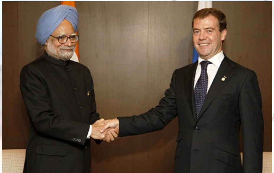
סינג עם מדבדב - האם הודו תפנה לחיזוק הקשרים עם רוסיה?

3. Ashok Sharma, "US airline probed after ex-Indian pres searched", AP, 21/07/2009