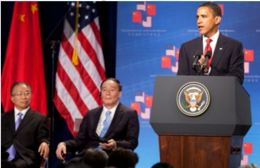
אובאמה עם המשלחת מסין. היחסים החשובים ביותר של המאה?

ינצלו את המצב כדי לפלוש לתוך צפון-קוריאה, ובכך להגיע עד הגבול הסיני.