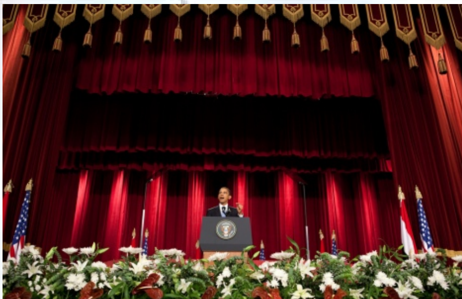
אובאמה בנאום לעולם הערבי בקהיר - יצליח להשיג שלום באזור?