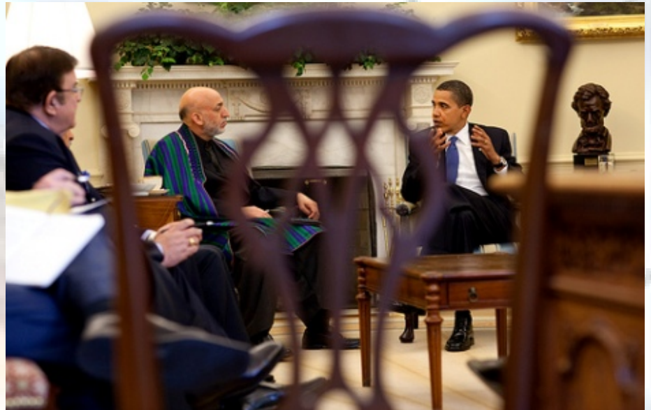
אובאמה עם נשיא אפגניסטן קראזי - יצליח לנצח את המלחמה בטרור?

לסינים יש חשיבות בעיני האמריקנים בפתרון לא מעט משברים בעולם. המשבר החשוב ביותר, אחרי המשבר הכלכלי, הוא המשבר הצפון-קוריאני. המפתח נמצא בבייגינג, מאחר וסין היא המדינה הזרה האוחזת באינטרסים הרבים ביותר בצפון-קוריאנה. התמוטטות צפון-קוריאנית, אם בשל המצב הכלכלי העגום, אם בשל תהליך חילופי השלטון במדינה, תוביל לזרם של מיליוני פליטים צפונה, לתוך שטחה של סין. הסינים חוששים כי תסריט שכזה לא יגבה מהם רק מחיר כלכלי אלא גם מחיר מדיני, במידה והאמריקנים והדרום קוריאנים