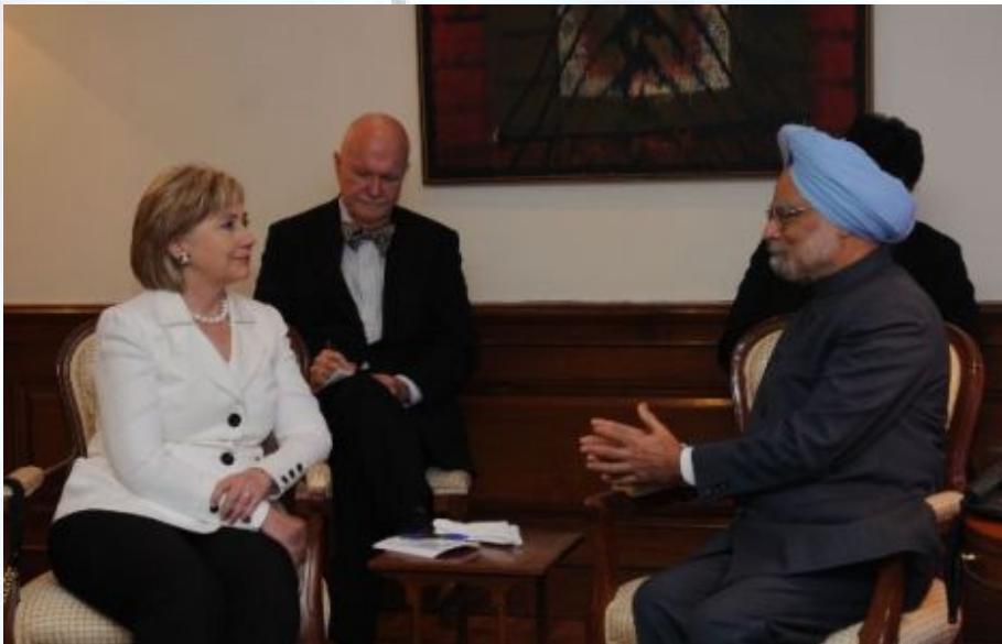
מזכירת המדינה קלינטון עם ראש ממשלת הודו סינג, בביקור המדובר.

ההנהגה ההודית, שביקשה לשמר על מערכת היחסים הקרובה עם האמריקנים, בחרה באיפוק לא פופולארי לאחר פיגועי הטרור שיצאו מפקיסטן. כיום, ההודים עדיין ממתנים לשינוי במדיניות האמריקנית, כזה שיכפה על הממשל הפקיסטני לשנות את דרכו ולפעול נגד כל הגורמים הרדיקליים הפועלים בשטחו.