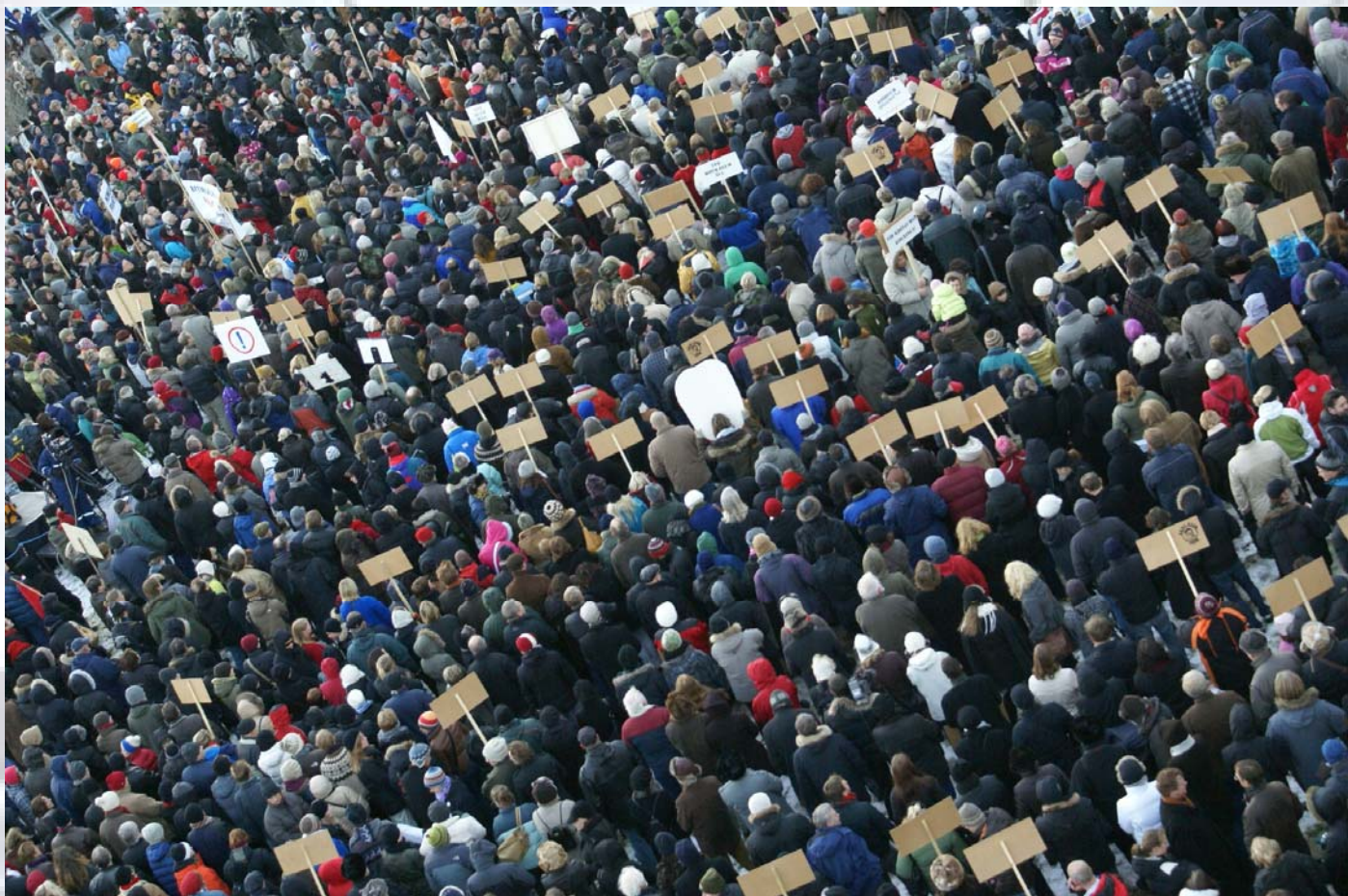
המחאה באיסלנד - הביאה להקדמת הבחירות ולמהפך.

כי בסוף העשור הבא, יתקרב מספר החברות באיחוד ל-40. מספר האזרחים יגדל בכ-70 מיליון ללא טורקיה או בכ-150 מיליון ביחד איתה. עלייה זו, בשיעור של 15% עד 30%, תחזק את האוכלוסייה העובדת באיחוד ותקל על המערך הסוציאלי, אך ודאי תגבה מחיר דמוגרפי שיביא לשינוי ברוח האיחוד, בפרט עם טורקיה תצטרף אליו.