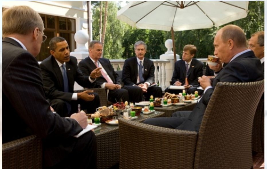
אובאמה עם פוטין - כיצד תיראה מערכת היחסים בין ארה"ב לרוסיה?

בעת ביקורו במוסקבה, הביע אובאמה נכונות לגנוז את תוכנית הצבת המערכת נגד טילים על אדמת אירופה במידה ויוסרו האיומים מצד איראן וצפון-קוריאה. הצהרה זו גלגלה למעשה את הכדור בחזרה למגרשם של מדבדב ופוטין.