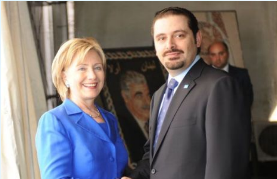
ראש ממשלת לבנון הנבחר, סעד חרירי עם הילארי קלינטון.