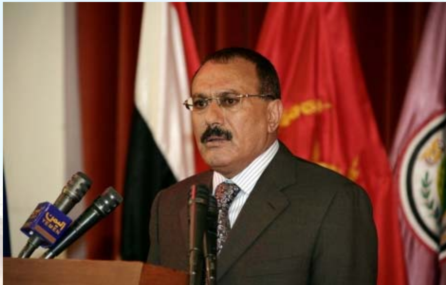
הנשיא עלי עבדאללה צלאח - יצליח להשתלט על המורדים

ההיסטוריה התימנית הקרובה יחסית, הובילה לפיצולה של המדינה מסיבות היסטוריות ומסיבות דתיות. אומנם אין צפי כזה באופק הקרוב לפיצולה של תימן, אולם במידה ומאבק הזיידים במחוז צעדא יצליח לסחוף אחריו את כלל הזיידים, הרי שתימן תעמוד בפני סכנה מיידית של מלחמת אזרחים ופיצול לשתי מדינות.