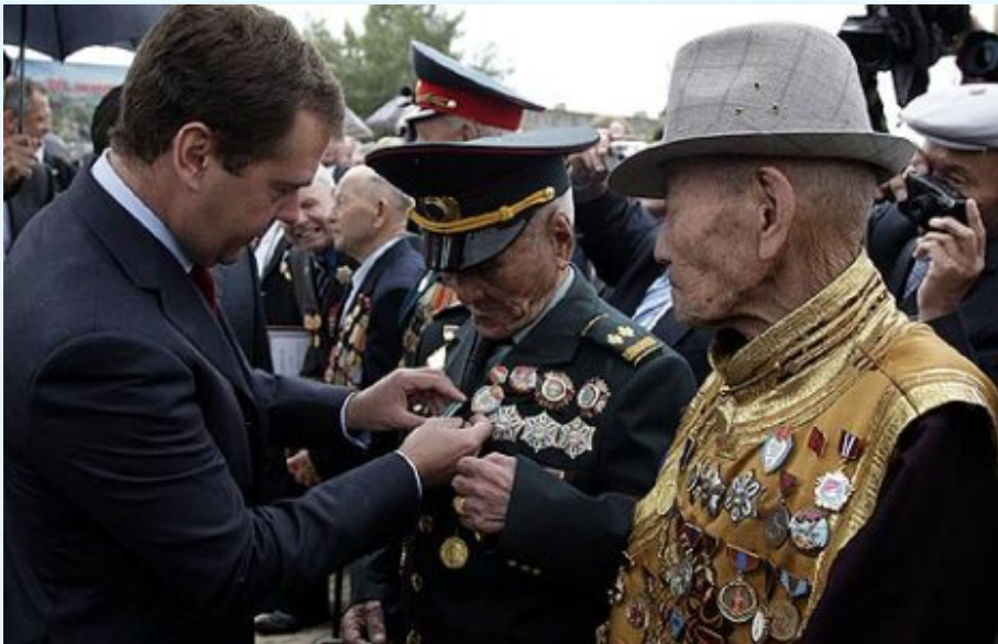
מדבדב מעטר גיבור מלחמה במונגוליה - רוסיה מרחיבה השפעתה במזרח.

השקעה בלתי מבוטלת על מנת לחפש שבטון מצבורי גז.