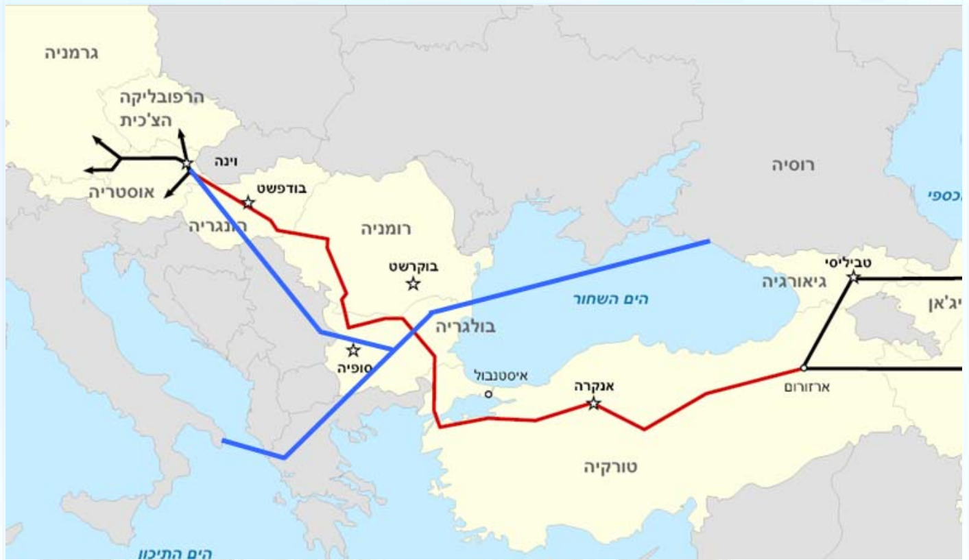
תוואי הצינורות היריבים. באדום - נבוקו, בכחול - הזרם הדרומי. איור: סמור, ויקיפדיה

במצב העניינים הנוכחי, נורמליזציה של היחסים בין טורקיה, ארמניה ואזרבייג'אן היא אינטרס רוסי מובהק, ואינטרס גם של כל אחת משלוש המדינות. בארמניה, חברות האנרגיה מייצרות זרבות גדולות מספיק אותן אפשר לייעד לייצוא. היעד המתבקש מן הזווית הארמנית הוא טורקיה ובמידה פחותה איראן וגיאורגיה. העובדה כי תאגיד האנרגיה הגרעינית של ארמניה נמצאה בשליטה רוסית, הופכת את הרצון הארמני למכור את עודפי הייצור לאינטרס רוסי [7]. במאי האחרון, הרוסים אף העניקו לארמניה הלוואה בהיקף של חצי מיליארד דולר לשם עידוד הכלכלה לאחר המשבר הכלכלי [8].