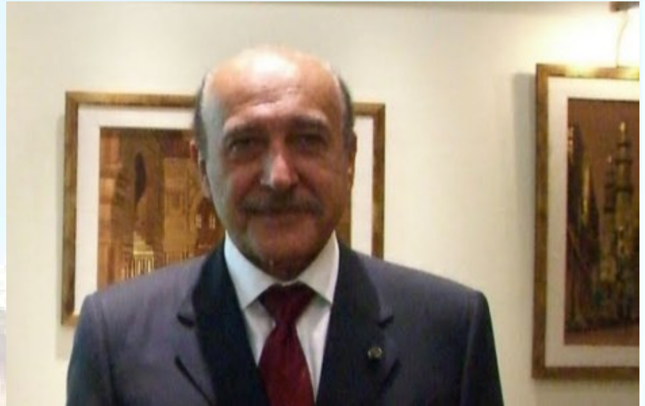
עומר סולימאן - יירש את מובארק או יישרת גם את בנו?

עומר סולימאן, ראש המודיעין המצרי ומי שנחשב למספר 2 במשטר המצרי, הוא אדם הנהנה מתמיכת הממסד הצבאי כמי שמגיע משורותיו. הוא זוכה להערכה רבה ברחבי המזרח התיכון בשל ניסיונו, הפרגמטיזם שהוא מפגין ויכולות ניהול המשא ומתן שלו. מאחר וגם הוא נהנה מאמונו המלא של הנשיא המצרי, הוא בעמדה טובה לא לזכות בתמיכת מפלגת השלטון ביום בו תוכרע שאלת הירושה.