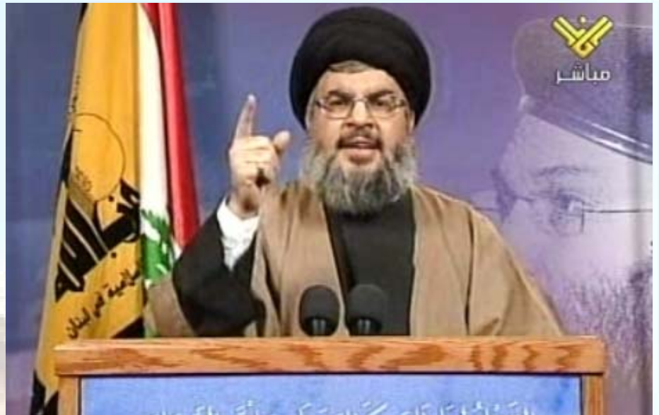
נסראללה - מכיר במגבלות כוחו.

הבחירות באיראן שכנעו את הנשיא האמריקני סופית כי איראן אינה פרטנר