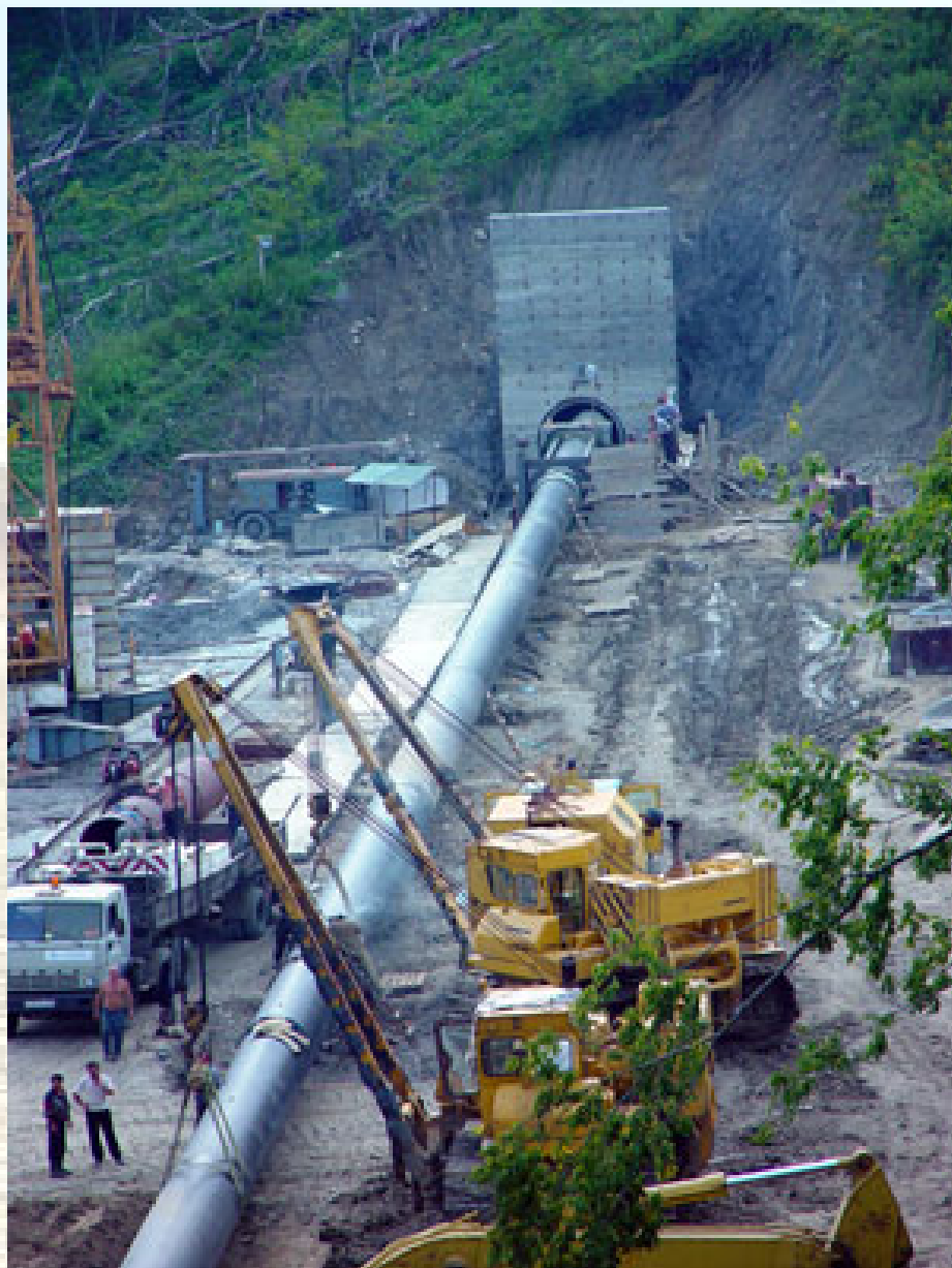
בניית צינור "הזרם הכחול" בין רוסיה לטורקיה.

הרוסים נמצאים בעמדה טובה לצאת מהמיתון – ברגע שהמערב יתאושש, תתחדש העלייה בביקושים לאנרגיה, ורוסיה תהיה שם כדי לספק את הצרכים. מחירי הגז והנפט שיעלו, ימלאו את הקופה הרוסית שהתדלדלה בשנה האחרונה, ורוסיה תשוב לעלות על פסי הצמיחה הכלכלית. מידת הצלחת כוונות המערב לחבל בתוכניות הרוסיות להשגת השליטה בשוק הגז העולמי, במציאת אלטרנטיבות לשאיבת הגז ולהובלתו, בצמצום הצריכה וכו', תשפיע במידה