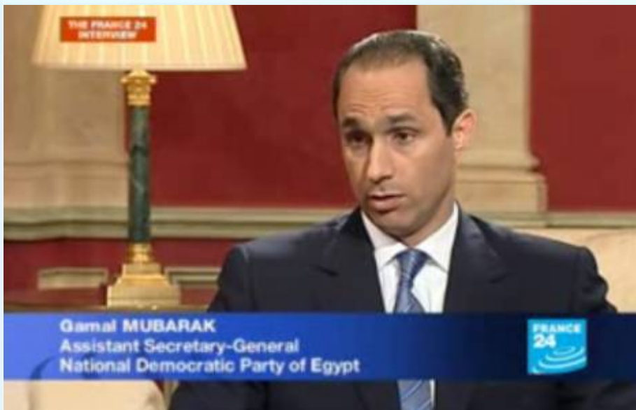
גימאל מובארק - האם השלטון במצרים יעבור בירושה?

של שני מיליארד דולר מהדוד סם, הסיוע השני בגודלו לאחר ישראל. הצבא המצרי מבוסס כולו על טכנולוגיה אמריקנית – מטוסי F-16 וטנקי אברהמס, אשר הופכים את הצבא המצרי שהיה מבוסס על כלים סובייטים, לזיכרון רחוק.