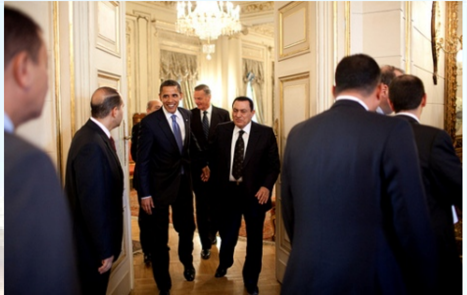
אובאמה עם מובארק - כמה זמן יחזיק עוד הנשיא המצרי?

מצרים תלויה באמריקנים מבחינות רבות. מדי שנה, היא מקבלת סיוע בהיקף