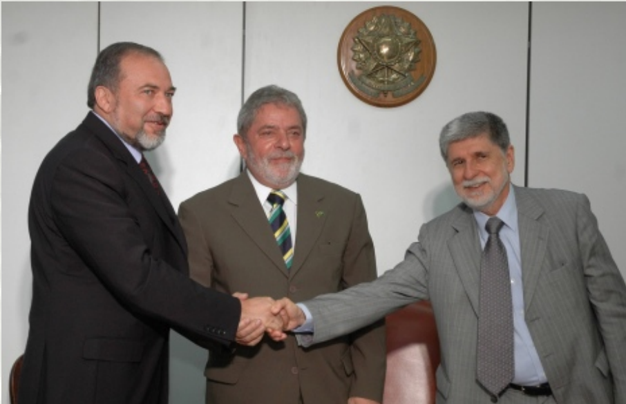
ליברמן בברזיל עם דה סילבה - ביקור ראשון אחרי 23 שנה.

במסגרת שינוי הטון במדיניות החוץ, החלה ישראל להקפיד יותר על כבודה הלאומי. פרסום בעיתון שבדי בדבר סחר באיברים של פלשתינים שביצעה ישראל לכאורה בימי האינתיפאדה הראשונה,