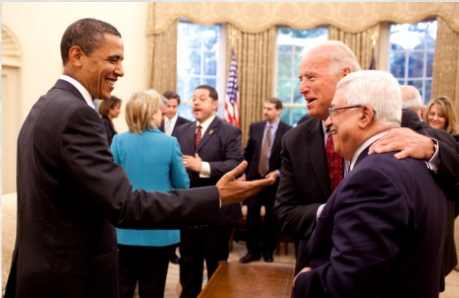
אובאמה וביידן עם אבו-מאזן - החיבה שהפגינו רק פגעה.

אובאמה הציג במהלך מערכת הבחירות האמריקנית ובוודאי לאחריה, גישה מדינית יונית, המבקשת למצות מהלכים דיפלומטיים. על פי תפיסה זו, המפתח להידברות מוצלחת כשאררה"ב משמשת כמתווך, מצריך ממצעמט-העל לשמור על ניטרליות. כשמדובר במדיניות של ממשל שירש את הממשל הפרו-ישראלי ביותר שראתה וושינגטון, מתפרשת אותה ניטרליות כאנטי-ישראליות, משני הצדדים.