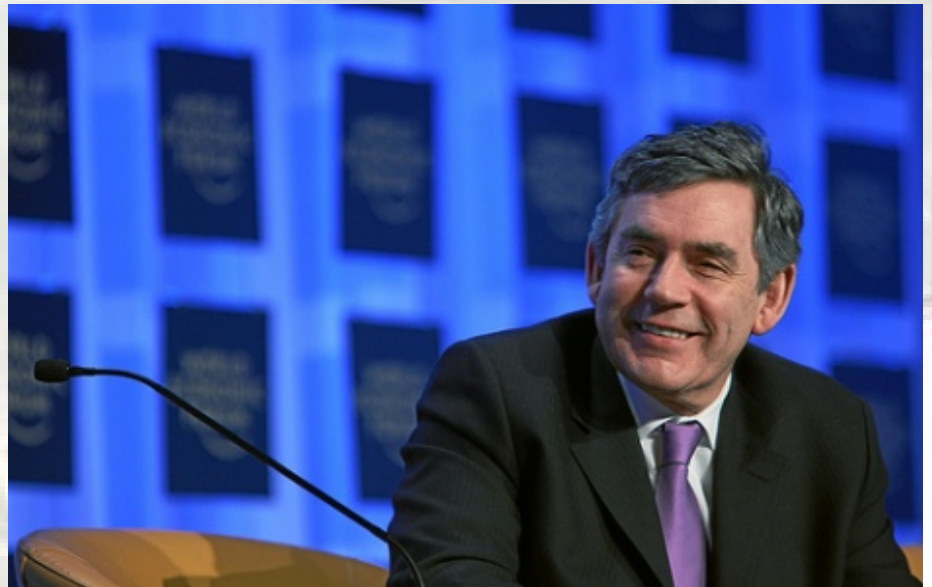
גורדון בראון - האם יפתיע ויזכה בכהונה נוספת?

בגרמניה, נערכו בסוף ספטמבר בחירות כלליות, שהבטיחו כהונה נוספת לקאנצלרית מרקל. התמיכה במפלגה השמרנית שלה ירדה ב-1.5%, אך היא עדיין זכתה לתמיכה של יותר משליש מהמצביעים. הנפגעת העיקרית של הבחירות היא המפלגה הסוציאל-דמוקרטית, שאיבדה כשליש מתומכיה בהשוואה לבחירות הקודמות ולא הצליחה להתקרב למפלגה השמרנית. מי שנהנתה מהירידה בכוחם של הסוציאל-