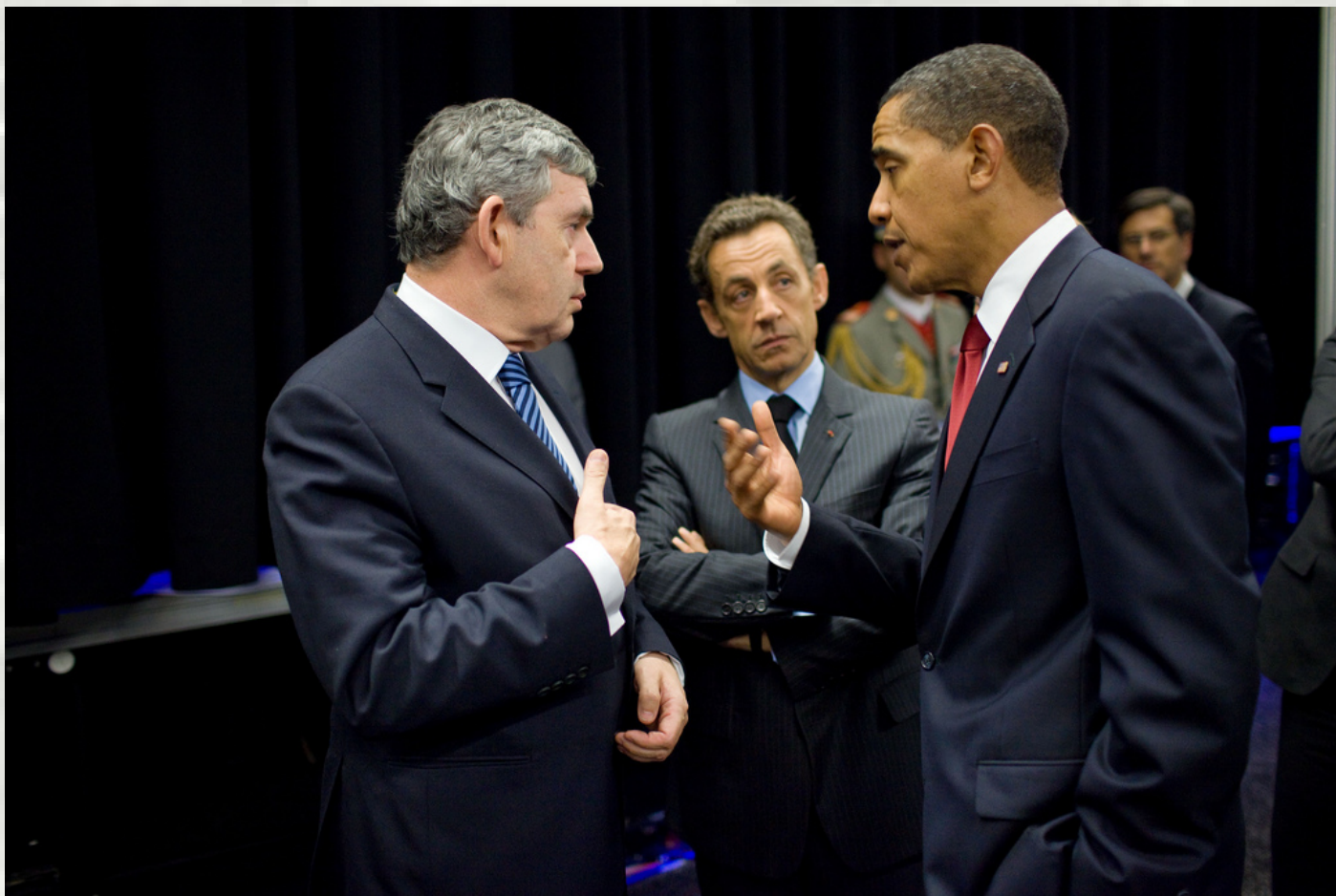
אובאמה, סרקוזי ובראון - תקיפים מתמיד.

הרוסים, הצרפתים והבריטים הגיבו בתוקפנות על המצב החדש שנותר. סרקוזי נקב בדצמבר כמועד פקיעת אולטימטום בטרם יוטלו סנקציות על איראן; מדבדב, לראשונה מזה זמן רב, דיבר בגלוי על הטלת סנקציות נוספות; מרקל הביעה דאגה מהגילוי החדש; גורדון בראון הביע תמיכה בסנקציות נוספות ולמעט הסינים, נראה כי נוצרה תמימות דעים בינלאומית לגבי הצורך ל יותר על איראן.