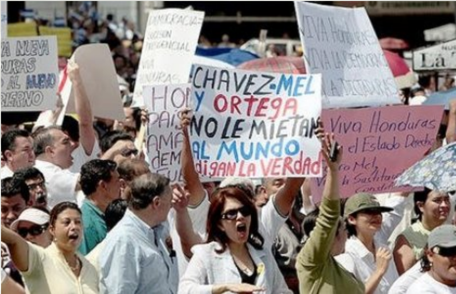
מפגינים נגד זלאייה - האם סגנו יזכה לתמיכה בבחירות?

עמוסות סחורה שמקורן ממדינות אלה ואשר היו צריכות לעבור דרך הונדורס, תקועות בגבול, והכלכלות מפסידות מיליוני דולרים מדי יום.