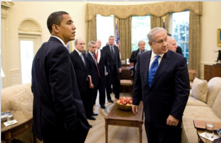
נתניהו עם אובאמה - התחילו ברגל שמאל.

מאז נכנס נתניהו לתפקידו כראש ממשלה, הוא פועל ביחד עם