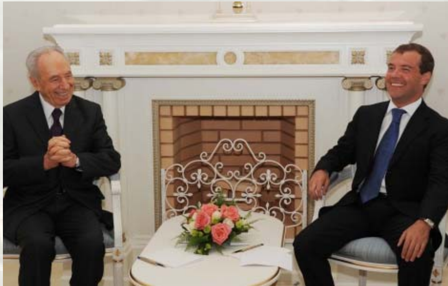
פרס עם מדבדב - הבטיח שישראל לא תתקוף: צילום: משרד החוץ הישראלי

בכל האמור לסכסוך הישראלי-פלשתיני, נראה כי להתעקשותו של אובאמה על שינוי דרמטי ומהיר כל כך במדיניות ארה"ב, לא היה סיכוי להצלח – כשהציג את מדיניותו החדשה ואת דרישותיו משני הצדדים, היה משוכנע כי הייתה זו גישה מאוזנת ונייטרלית. בפועל, השינוי