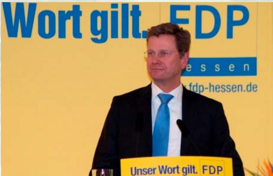
גוויידו ווסטרוול - שר החוץ הבא של גרמניה?

אחד הנושאים הראשונים שיעסיקו את מנהיגי האיחוד בחודשים הקרובים הוא מצבה של ספרד, שנפגעה באופן הקשה ביותר מהמשבר הכלכלי. החרפת המגמה השלישית הביאה את קרן המטבע, באופן לא אופייני, להוציא בתחילת אוקטובר הודעת אזהרה על מצב המשק הספרדי, ובה לא מעט ביקורת הממשלה, שהימנעותה מרפורמות מעכבת את ההתאוששות, לדעת כל מומחי הקרן [10].