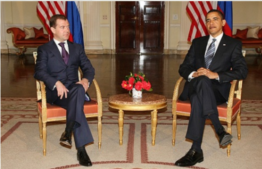
אובאמה עם מדבדב - סיום משבר הטילים ירתום את הרוסים לעזור

האיראנים בודאי בונים אף הם על הסיוע הסיני, אך הסיטואציה האיראנית בעייתית עבור הסינים. בכל המקרים שנזכרו לעיל, לא עמדה סין לבדה בפני לחץ בינלאומי מסיבי. במקרה של בורמה, הייתה זו רוסיה שהצטרפה להתנגדות לסנקציות ובמקרים של שתי המדינות האפריקניות, נראה כי חוסר העניין