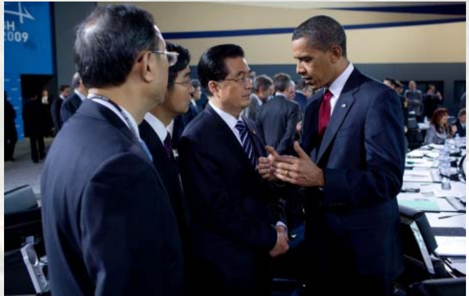
אובאמה עם הו ג'ינטאו - המכשול האחרון בדרך ללחץ גורף על איראן.

12. "Israel rethinks anti-Iran warnings", Reuters, 30/09/2009