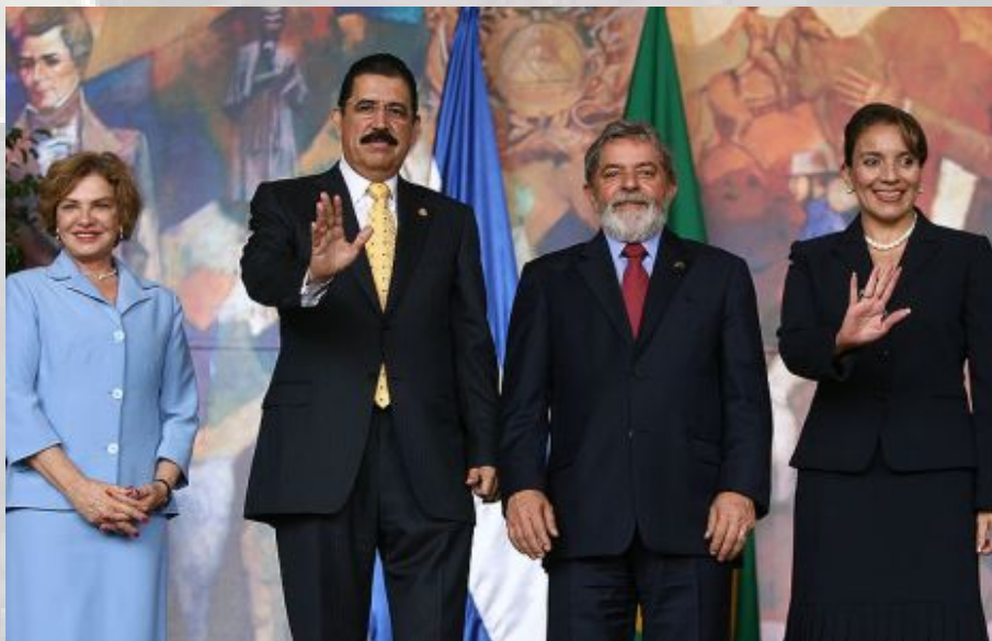
זלאייה עם נשיא ברזיל דה סילבה - קיבל הגנה בשגרירות.

זלאייה, הודח לפני שלושה חודשים, לאחר שביקש לבצע שינויים בחוקה, שינויים שביטל המשפט העליון פסק פעם אחר פעם כי אינם חוקתיים. לאחר שהתעלם מצווים של בית המשפט העליון, נשלח כוח צבאי לביתו כדי לגרש אותו מהונדורס. מאז חזר זלאייה להונדורס, ומאז ה-21 בספטמבר הוא מתגורר בשגרירות ברזיל, המעניקה לו חסות מפני כוחות הממשלה, הצרים על השגרירות. אלנר משמיע את הדברים באופן בוטה ואנטישמי, אולם