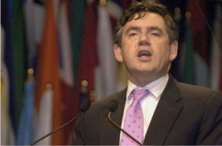
גורדון בראון – עומד לסיים את תפקידו?

המשבר בכלכלה העולמית גובה את מחירו גם מהבריטים, שתולים את האשם במדיניות הכלכלית הכושלת שהוביל בראון בשנותיו במשרד האוצר, ואשר מוביל כעת מחליפו, אליסטר דארלינג. המשבר הכלכלי הנמשך גרם