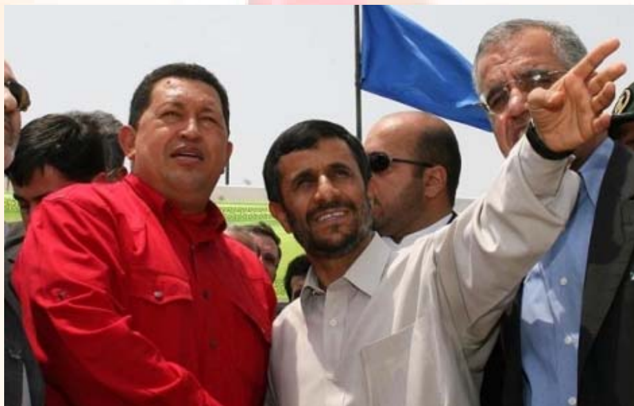
ציאבו עם אחמדינ'אד – השפעתם תצטמצם בקרוב.

1. "Venezuela's Chávez says governments must confront food crisis", AP, 19/04/2008