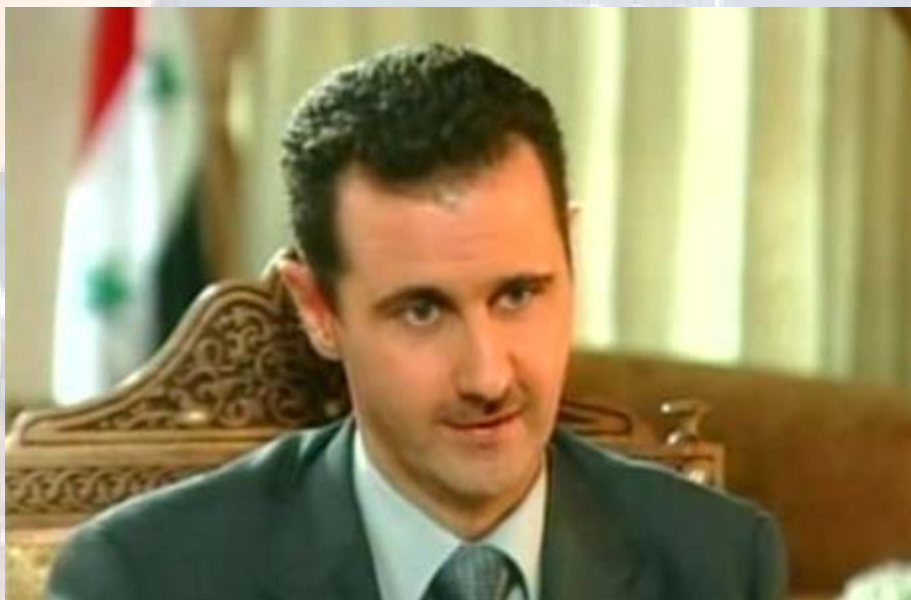
באשר אל אסד - במצוקה.

עוד ב-2002, בנצלו את הכיסא הסורי במועצת הביטחון, פעל אסד בכדי למנוע מפלישה אמריקנית לעיראק. משנכשל בכך, עבר להתנגדות פעילה יותר ועודד טרור בתוך עיראק כנגד האמריקנים, ובין העיראקים לבין עצמם. על אף שהפעילות הזו הצליחה לגרום למלחמת אזרחים ולשקיעה אמריקנית בבוץ העיראקי, התפוצצה ההחלטה הזו במהרה בפרצופו של אסד - מאות מהגרים עיראקים שנסו מהקרבות בעיראק, הגיעו לתוך שטחה של