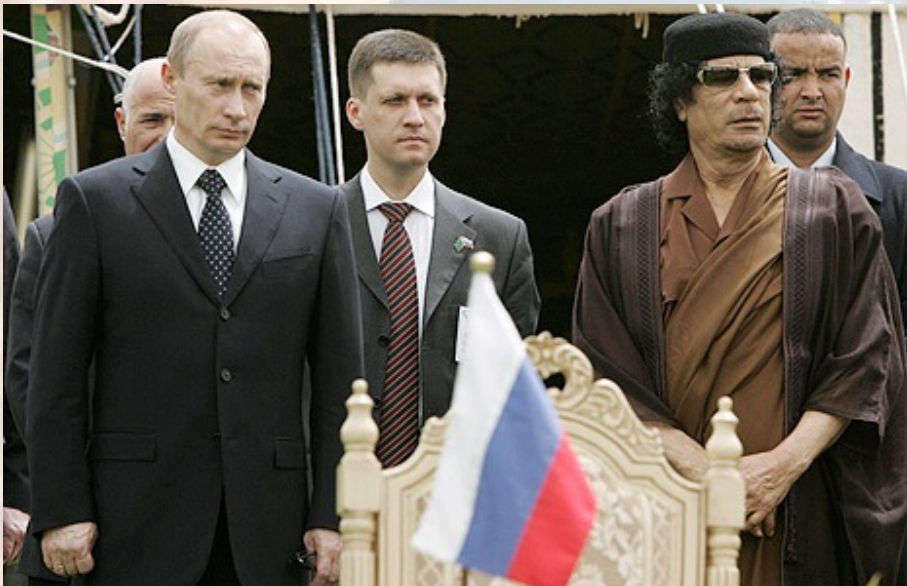
קדאפי עם פוטין, בביקורו ההיסטורי של הנשיא הרוסי בלוב.

פוטין לא הסתפק בכך, ועל רקע שידוליו של סרקוזי, פעל להעצים עוד את ההשפעה הרוסית באזור. במרץ 2008, הגיע נשיא מצרים מובארק לרוסיה. במהלך הביקור חתם עם מארחיו הרוסיים על הסכם להקמת כור גרעיני ראשון במצרים [14].