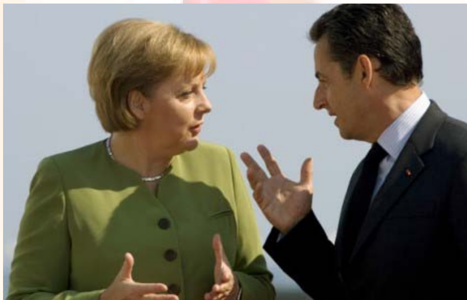
סרקוזי ומרקל – מובילים ביחד את האיחוד האירופי. צילום: ועידת ה-G8 בגרמניה

היוזמה הפולנית, כך על פי הממשלה היושבת בוורשה, זוכה לתמיכת גרמניה וצ'כיה. הפולנים הבטיחו להציג תוכנית