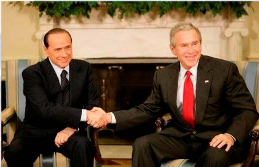
ברלוסקוני עם בוש - חוזר לעניינים.

הנציבות האירופית עדכנה זה מכבר את תחזית האינפלציה ל-3.2% השנה, זאת, בהשוואה ל-2.1% בשנה שעברה. תחזית הצמיחה השנתית ב-15 המדינות שאימצו את האירו הורדה ל-1.7%, בעוד תחזיות מוקדמות קיוו ל-2.2% צמיחה. אפילו בספרד, המדינה שהציגה שיעורי צמיחה גבוהים מהממוצע היוורו במשך כל העשור האחרון, עודכנו המספרים כלפי מטה. אנשי המחקר של מגזין האקונומיסט מעריכים כי